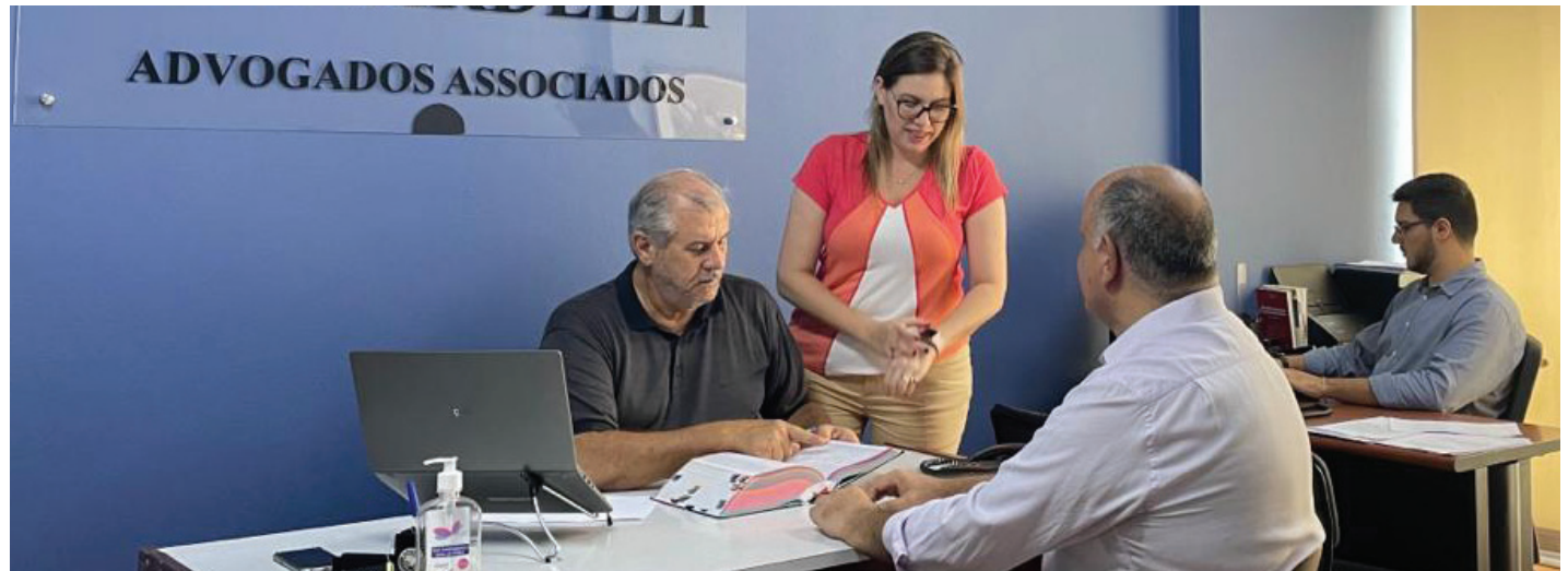
AGENDE - Atendimento com hora marcada. Ligue na nossa sede e subse-des

SEDE - Atendimento odontológico, jurídico e salão de cabeleireiro.